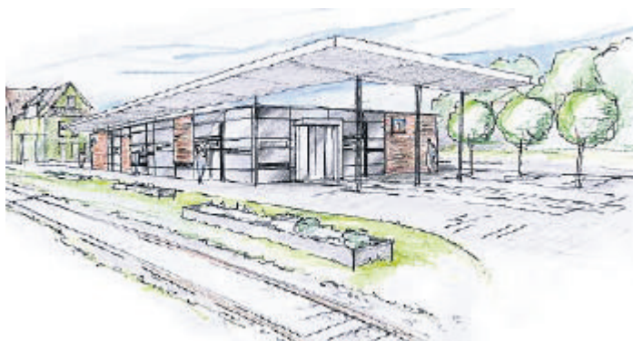
So soll die neue Filiale der Volksbank in Salzhemmendorf aussehen.